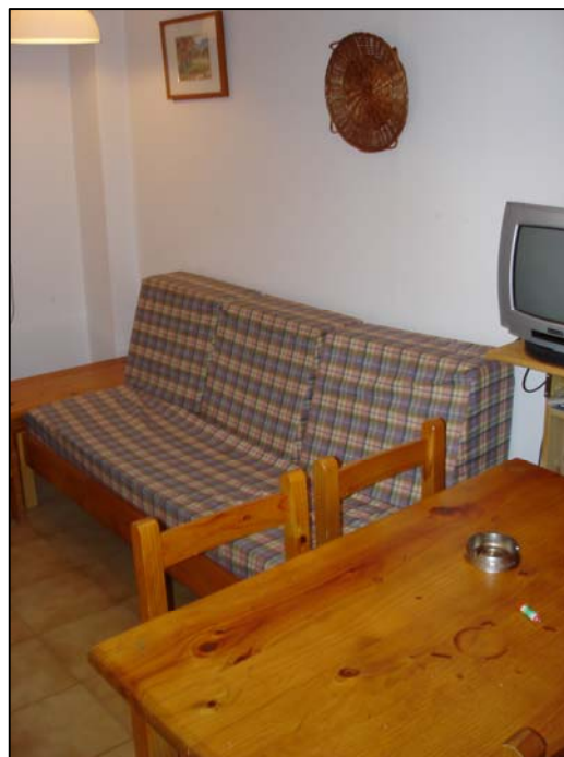
Comedor –Sala de estar