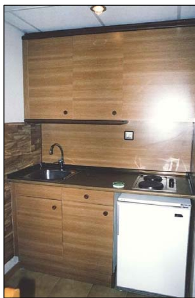
Cocina Tipo Office