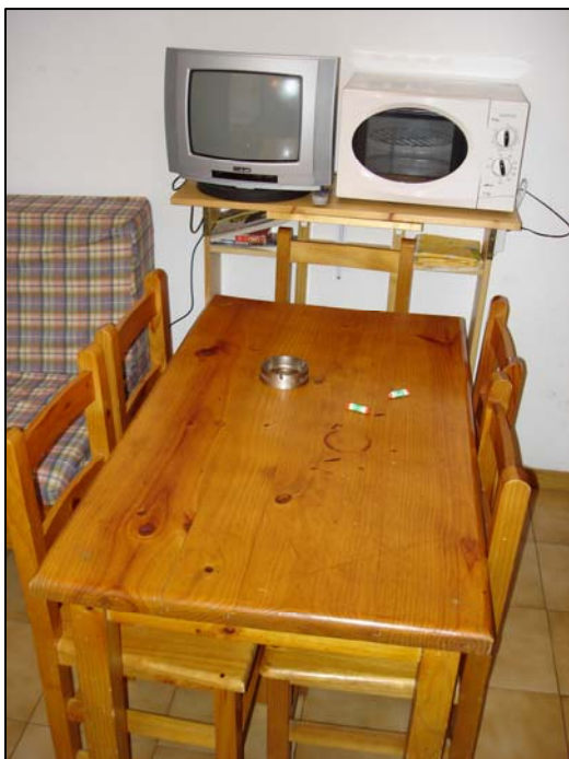
Comedor TVC y microondas con grill.