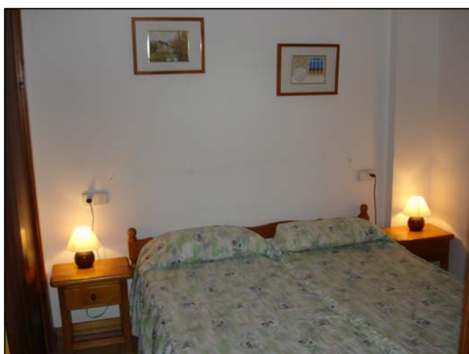
Habitación desde Sala de estar