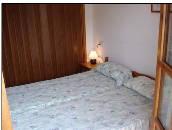
Habitación desde Balcón